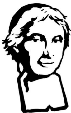
Saint Bénilde, priez pour nous