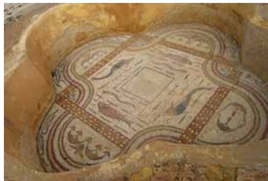
Sbeïla (Tunisie) : ruines romaines